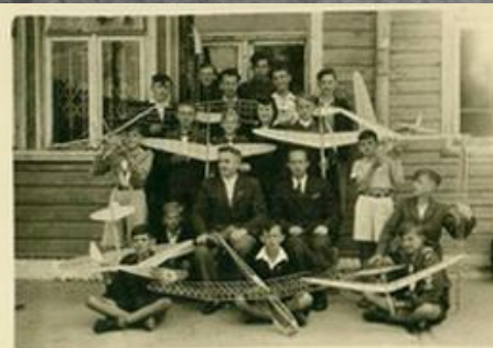
Modelarnia lotnicza Aeroklubu Podkarpackiego w Iwoniczu- Zdroju 1947 r.