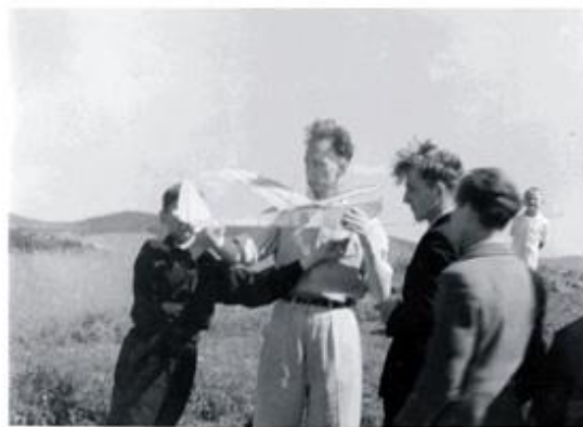
Pierwsze starty modeli szybowców.